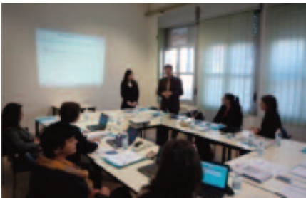
Мота ди Ливенца 27-28/1/2015