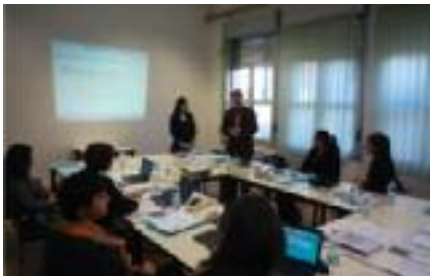
Motta di Livenza 27-28/1/2015